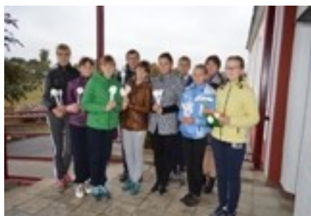
«ЮВЕНТА» на старте.

14 сентября в рамках Всероссийской акции, посвященной безопасности школьников в сети Интернет» прошел открытый урок "Интернет-безопасность для детей". В мероприятии приняли участие юноши и девушки старших классов.