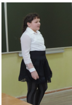
«Как Маруся начала учиться» Е. Шварц