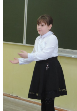
Ю. Коваль «Дед, баба и Алеша»