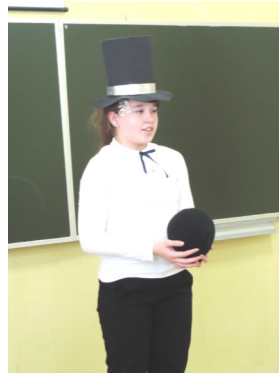
Р. Распэ «Верхом на ядре».