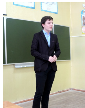
А.П. Чехов «Маска»