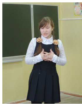
Н. Абгарян «Манюня»