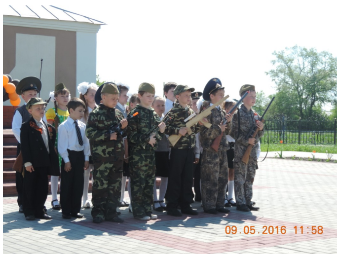
Выступление начальных классов с инсценировкой песни «Служить России»