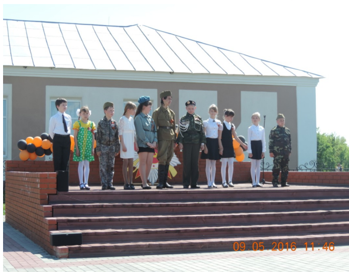
Выступление хора «Веселые нотки»