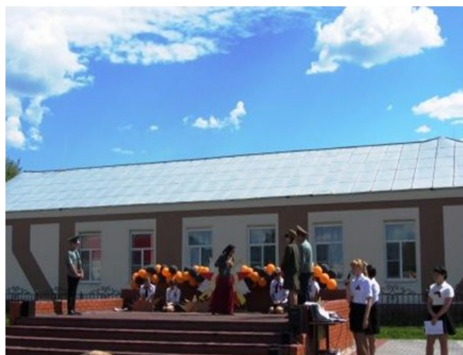
Выступление 8 класса с песней «Баллада о матери»