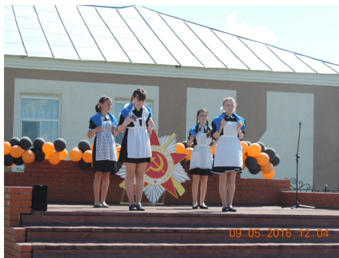
Выступление 7 класса с танцевальной композицией «Синий платочек»