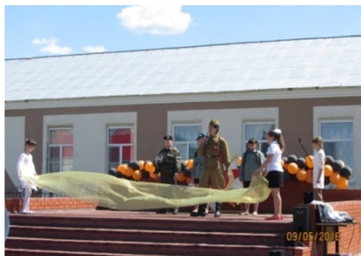
Выступление 6 класса с песней «Там, за туманами»